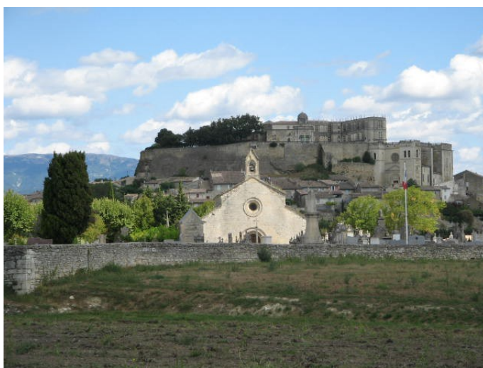
La chapelle Saint-Vincent – Grignan